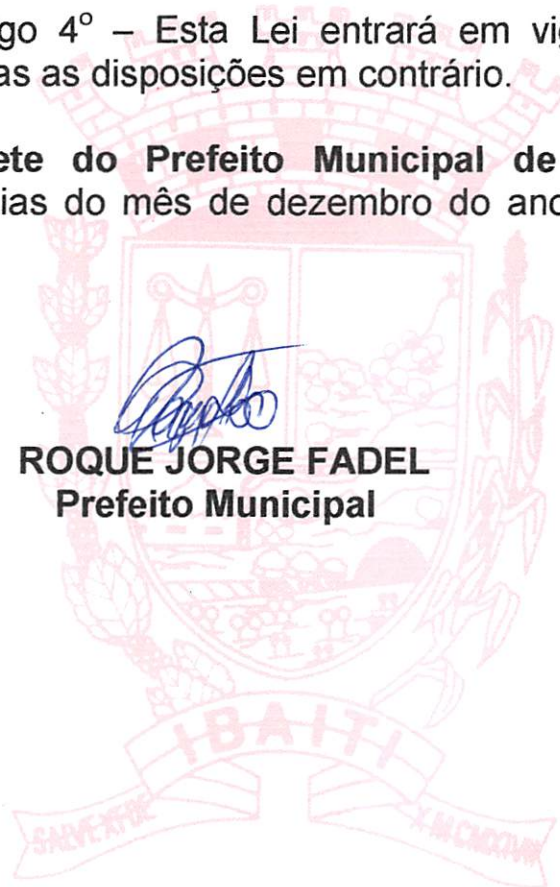
ROQUE JORGE FADEL Prefeito Municipal

Gabinete do Prefeito Municipal de Ibaíti, Estado do Paraná, aos vinte dias do mês de dezembro do ano de dois mil e dois. (20/12/2002).